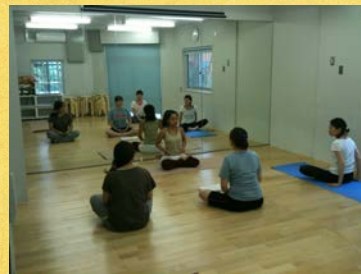
レンタルスペースとして地域に貸出