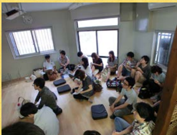
大学の授業フィールドとして使用